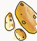
potomme de terre