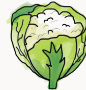
chou-fleur blanc, chinois, frisé, rouge